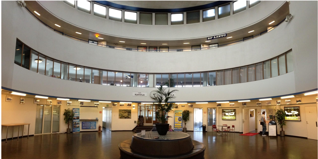
Kuva 2. Terminaalirakennuksen aula, joka voisi soveltua yleisötapahtumaan.