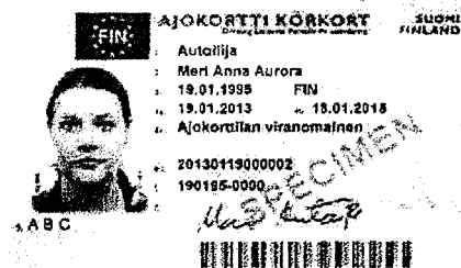
Esimerkki ajokortista, joka käy henkilötodistuksena.

Tilinkäyttörajoitus estää muun muassa kortin käytön, käteisnostot, laskunmaksun, luotonmaksun sekä automaattisten maksusopimuksien ja e-laskujen toimivuuden.